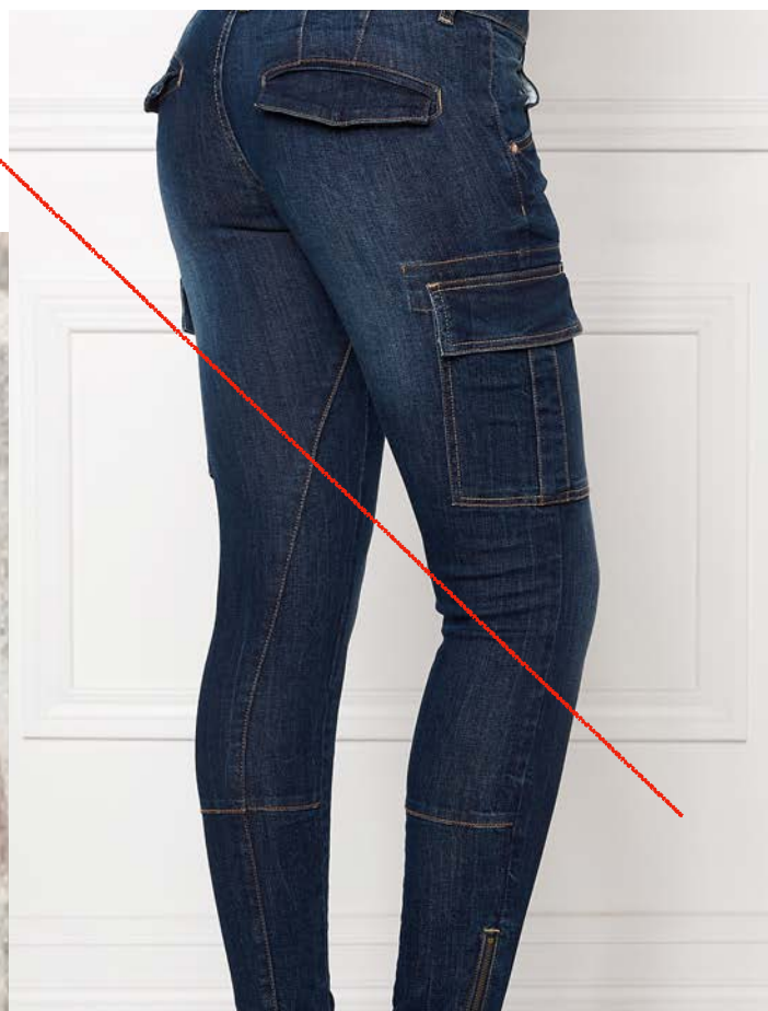
sömmar och fickor